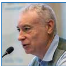
Stefano Di Battista