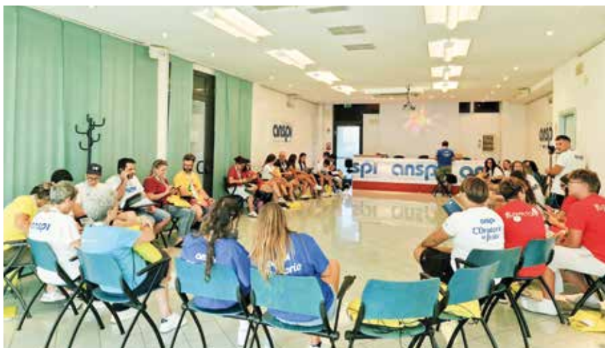
Una delle aule dove si è svolta la Summer school era dislocata nel Palazzo del turismo di Bellaria Igea Marina, da sempre quartier generale dell'Anspi

Partito il 18 aprile 2025 il progetto Reti in Gioco! mira a liberare le potenzialità dei ragazzi, ma non solo, con forme nuove di intrattenimento