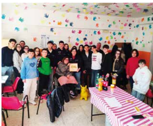
Zungoli (Avellino): la presentazione all'oratorio San Nicola