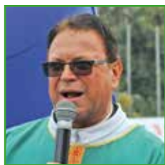
di Luigi Pellegrini