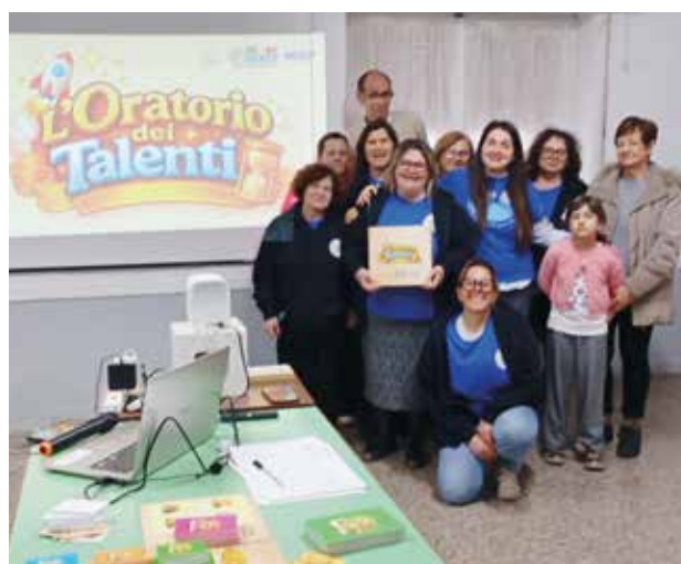
I bambini e gli animatori dell'oratorio San Vito di Taranto