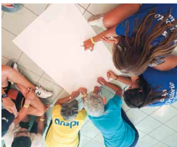
La Summer school prevedeva anche attività laboratoriali e di gruppo

Su tali domande è nato il convegno Giochiamo? Il gioco che fa bene, il gioco che fa male , condotto da Gabriele Mari e Alessio Perniola nell'ambito della Summer school, durante la rassegna L'oratorio in festa . Il convegno ha esplorato questa duplice natura: da un lato risorsa educativa capace di favorire crescita, inclusione e relazioni; dall'altro, l'ambito complesso, che nel contesto odierno può esporre a rischi, specie quando legato a dinamiche digitali e a forme di intrattenimento poco consapevoli. La Summer school ha rappresentato quindi molto più di un evento inaugurale: è stata un laboratorio di idee, in cui si sono intrecciate esperienze, competenze e visioni, ponendo le premesse per il gioco da tavolo L'Oratorio dei Talenti . Qui si è iniziato a costruire quella rete che dà nome al progetto, pronta a mettersi in gioco per rispondere alle sfide del presente.