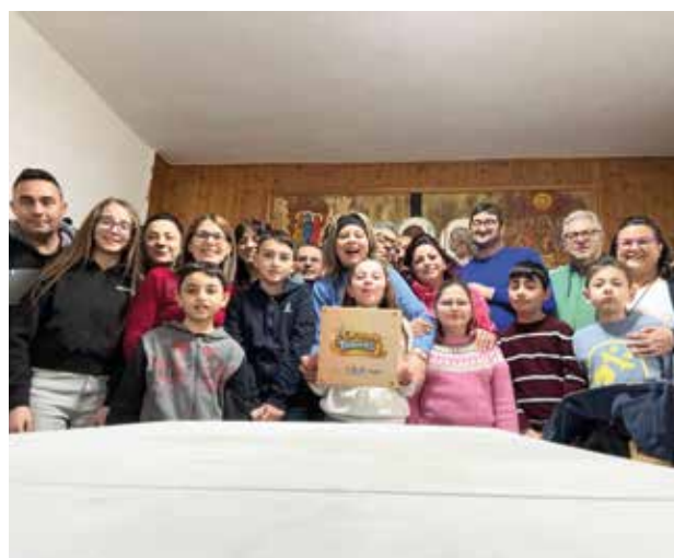
Lacedonia (Avellino): l'oratorio Santa Maria Della Cancellata