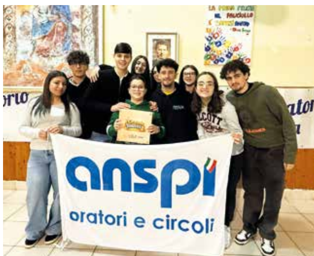
San Clemente (Caserta): i ragazzi dell'oratorio Don Antonio Sapone