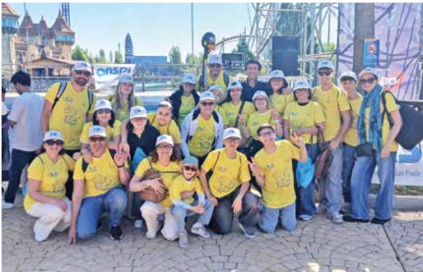
Da Fasano (Brindisi), l'oratorio Don Cosimo Decarolis