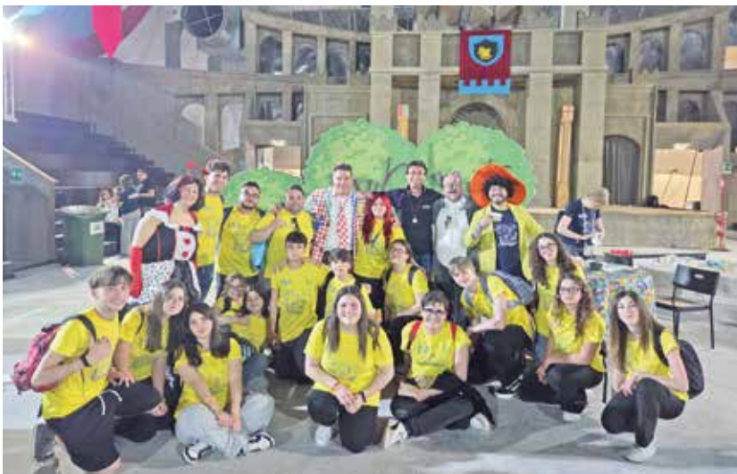
Avellino, oratorio Maria Santissima di Montevergine