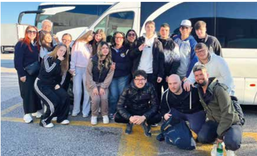
Da Carapelle (Foggia) il gruppo composto dagli oratori San Potito e Don Bosco