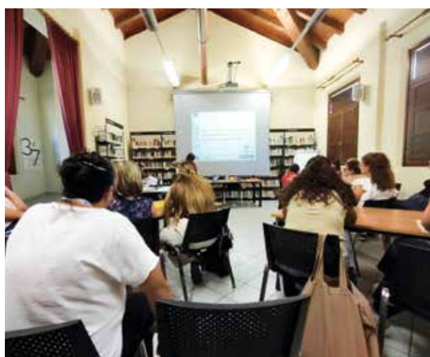
L'aula dove si è svolto il master del 6 settembre era ospitata nella biblioteca Alfredo Panzini di Bellaria