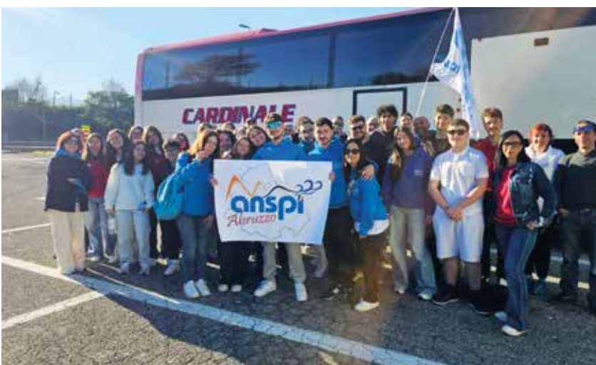
Dall'Abruzzo, quattro oratori provenienti dagli zionali di Pescara e dell'Aquila