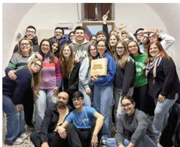
Rutigliano (Bari): entusiasmo all'oratorio Monsignor Di Donna