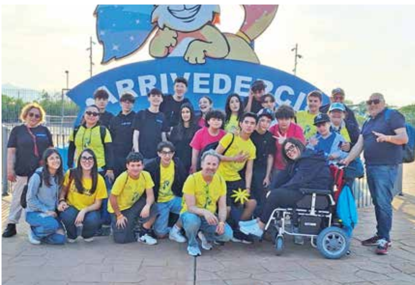
Da Zungoli (Avellino) l'oratorio San Nicola

Il lancio del sussidio che si è svolto il 19 aprile ha condotto ragazzi e adolescenti alle porte di Roma per una giornata che è stata di festa e di riflessione sulla stagione che verrà