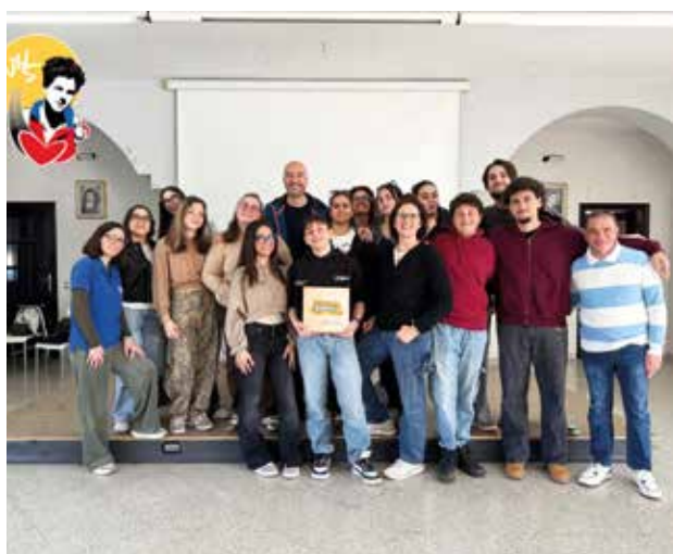
Bisceglie (Barletta): l'oratorio Carlo Acutis