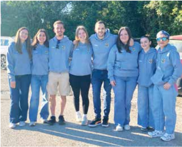
Da Fabriano (Terni) i ragazzi degli oratori Pier Giorgio Frassati e Carlo Acutis