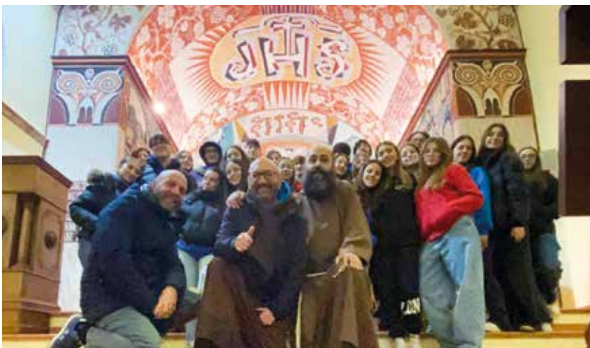
Due immagini degli animatori che hanno partecipato al ritiro di Leonessa

La due giorni tuttavia, non è stata soltanto teorica: i ragazzi infatti, a Leonessa hanno fatto pratica di oratorio accogliendo i bambini del paese. La proposta si è caratterizzata per una goccia di carta blu, su cui ognuno ha scritto che sete avesse (di amicizia, di felicità, di attenzione, di perdono), disponendo poi le gocce su un cartellone. Divisi in squadre, i bambini hanno poi dato vita a un gioco a staffetta, dove bisognava portare l'acqua da un pozzo (nel nostro caso un secchio) alla propria caraffa, facendo capire che c'era bisogno dell'aiuto di tutti per raggiungere l'obiettivo. A conclusione della giornata si è svolta una caccia al tesoro.