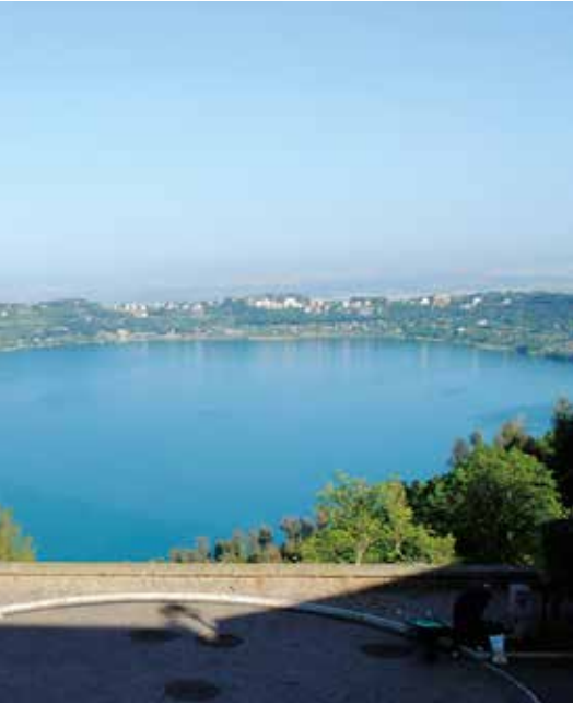
Il Lago di Nemi, detto Specchio di Diana, ripreso da Ariccia

reperendo nuove risorse attraverso i nostri partner commerciali, per offrire aiuti concreti ai circoli nella gestione amministrativa».