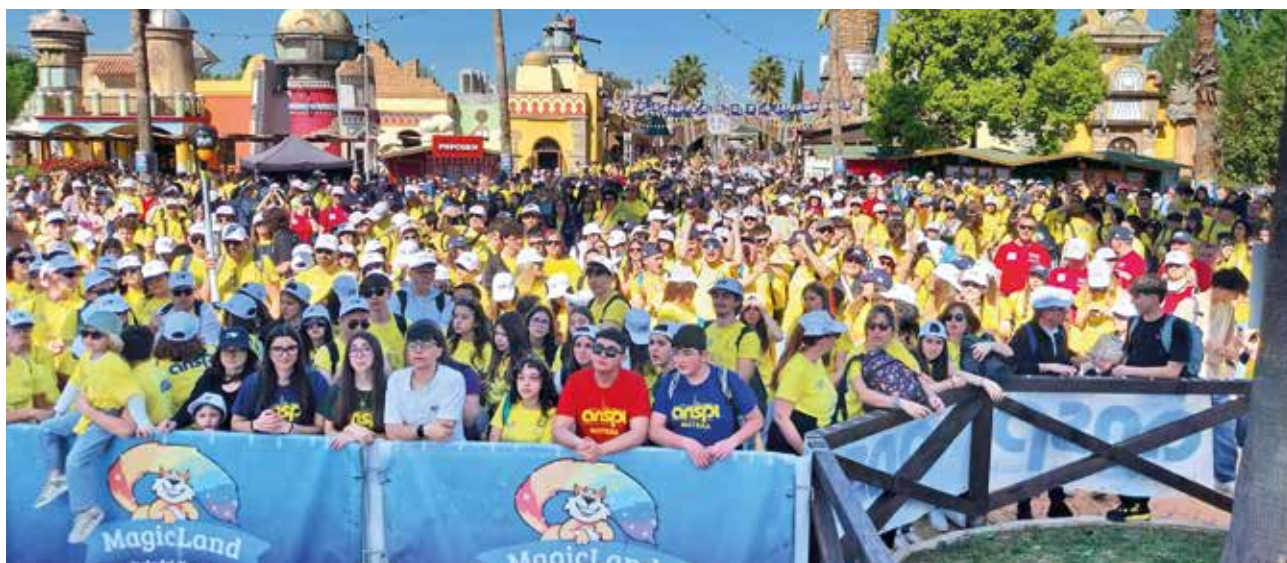
Il colpo d'occhio che ha aperto la giornata del 19 aprile a MagicLand dal palco intorno a cui è avvenuto l'accoglienza

“ 2.900 le persone che hanno partecipato al lancio del sussidio estivo: fra loro erano presenti 1.473 animatori